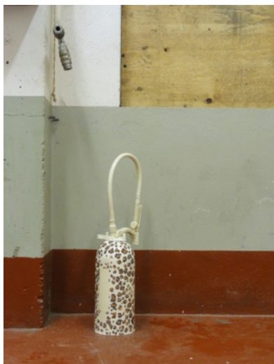
Chloé Jarry, Salope, 2011, ©Adrien Guigon