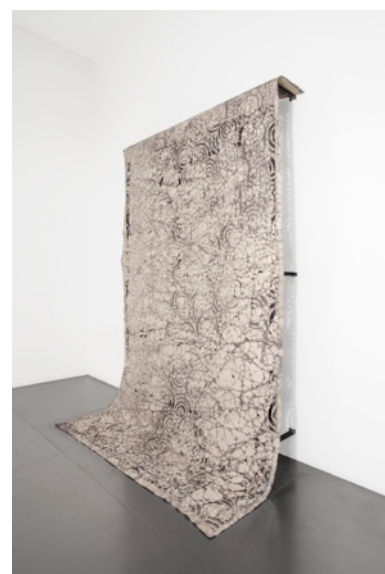
Morgane Tschiember, Skin , 2013

La Galerie Lefebvre & Fils est heureuse de présenter Tout feu Tout flamme , group show exceptionnel réunissant onze artistes internationaux autour d'œuvres-céramique.