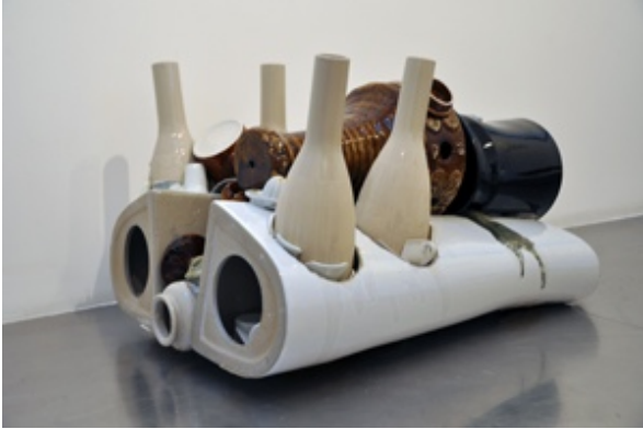
Dewar & Gicquel, Mixed Ceramics (n°1), 2010